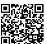
掃一掃有片睇

立法會議員、民建聯副主席周浩鼎亦在社交平台貼文表示，香港有獨立的司法制度，美國政府如此叫囂，企圖干預法庭審訊，注定徒勞無功。如此惡劣行為，只突顯美國政府為達打壓中國的政治目的，竟踐踏他人司法制度的醜陋嘴臉，我們全社會強烈譴責。