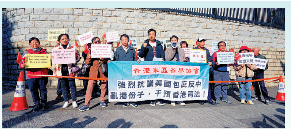
香港東區各界協會昨日到美領事館示威，抗議美國政府粗暴干預香港司法。