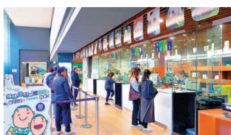
香港郵政正聯絡美方的安排。

當地時間2月7日，特朗普又簽署行政令，暫緩執行對來自中國的小額包裹徵收關稅，維持早前的「小額免稅」政策。該措施距離此前取消這一免稅門檻僅數天。在不到一周內，多次出現朝令夕改，施政混亂不堪。