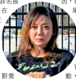
早在2019年5月時，劉喬安就以臨時訪客簽證進入美國，原本必須在2019年8月離境，但她並未遵守規定，非法滯留在美。檢察機關公訴部門檢調數年前追查一個藏有可卡因，從美國寄回台的毒郵包，結果發現，上游就是劉喬安。

【大公報訊】記者任芳頡報道：因參加台灣島內2014年「太陽花運動」而受到關注，甚至被稱為所謂「太陽花女神」的劉喬安（圖），於日前在美國因非法滯留等罪名被捕。1月22日，劉喬安曾在社交媒體發文介紹生活近況，並自曝住在波士頓一家酒店內，被網民嘲自曝行蹤。據媒體報道，劉喬安將於近日被遣返回台。