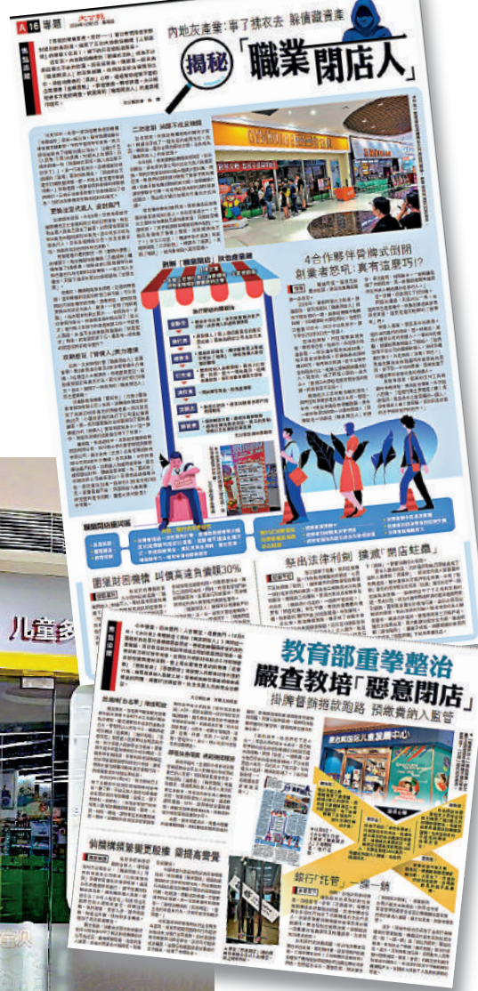
去年12月，大公報專題報道揭秘了「職業閉店人」灰色產業鏈，聚焦其幕後操縱、虛假註銷、逃避債務及消費者權益受損等亂象，引起廣泛的社會反響。