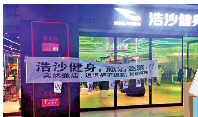
▲某家突然倒閉的健身房門口，會員拉橫幅要求退款。