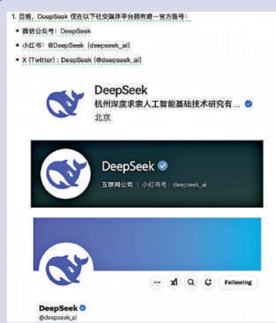
DeepSeek 官方聲明只在微信、小紅書及 X 設有社交賬號。