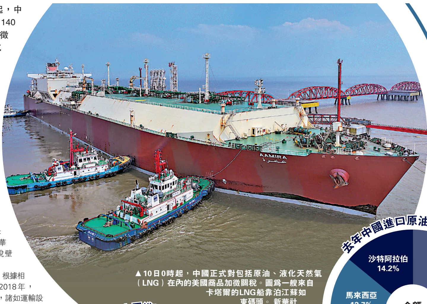
▲10日0時起，中國正式對包括原油、液化天然氣（LNG）在內的美國商品加徵關稅。圖為一艘來自卡塔尔的LNG船靠泊江蘇如東碼頭。

數據顯示，美國在能源領域對華順差為1566.76億元人民幣。「玉淵譚天」認為，這凸顯了中國反制措施的精準性。而據「玉淵譚天」披露，2月10日，中國貿促會帶着30多家國內知名企業前往哈薩克斯坦，當中三分之一企業來自能源領域，將與當地企業在油氣貿易、清潔能源等領域簽署合作意向。接下來，貿促會還將攜中國企業前往中東、中亞、歐洲、非洲等地開拓多元化市場，商談油氣貿易、汽車、農業機械等方面的合作。