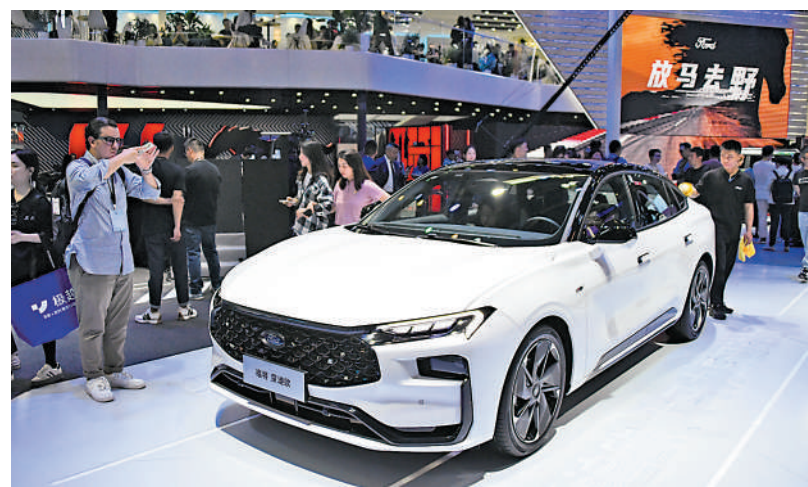
▲加徵關稅後，美系車三巨頭料將大受影響。圖為福特產品在去年北京車展展出。