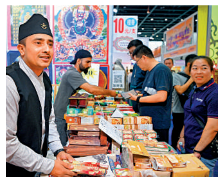
▲去年9月，約旦客商在廣西南寧的中國—東盟博覽會上招攬觀眾。新華社