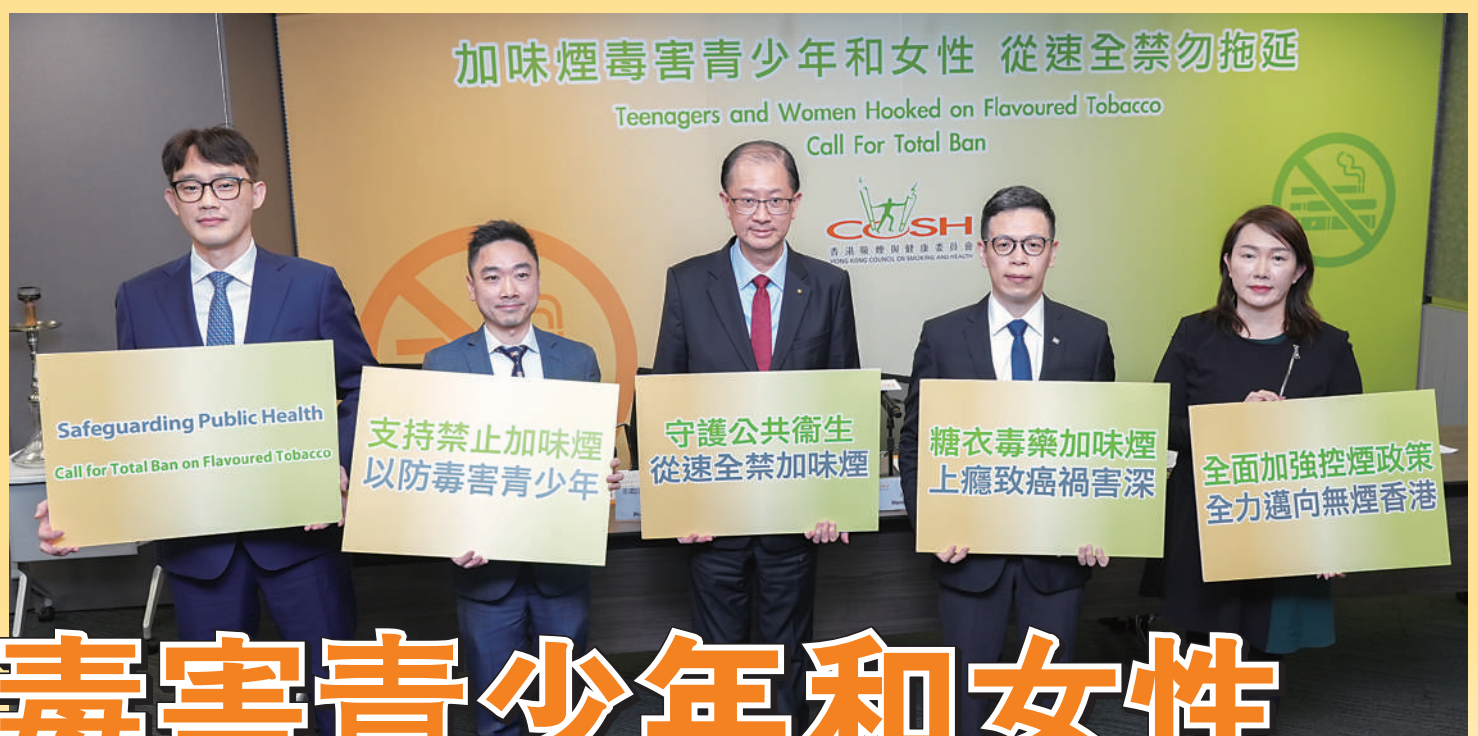
▲香港吸煙與健康委員會與香港大學學者建議政府立法禁止任何可添加味道至捲煙的配件等。

政府計劃展開下一階段控煙措施，以多管齊下的方式抑制煙草的廣泛流行，保障公眾健康。香港吸煙與健康委員會(委員會)聯同香港大學學者建議政府立法全禁加味煙，即涵蓋添加所有口味包括薄荷在內的吸煙產品，以至任何可添加味道至捲煙的配件等，同時盡快進一步禁止以任何形式管有另類吸煙產品，保障市民免受煙草危害，長遠達至無煙香港。根據委員會及香港大學的相關控煙調查研究，青年和女性吸加味捲煙比率較高，尤其是15至29歲女性吸捲煙者當中有近九成吸加味煙，而煙草產品的調味劑增加吸煙者成癮度，令吸煙人士更難成功戒煙。調查亦顯示有逾七成市民支持禁止加味煙草產品，且比率持續上升。