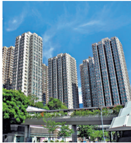
▲屯門時代廣場有業主持貨不足1年沽樓，賬蝕逾一成。

粉嶺高爾夫·御苑有一手業主蝕幅更超過三成。消息指出，高爾夫·御苑7座低層G室開放式單位，實用面積280方呎，原業主早於2017年5月以452.33萬元向發展商購入，早前以368萬元放盤，近日降價至288萬元沽出，實用呎價10286元，持貨近8年賬蝕164.33萬元，單位貶