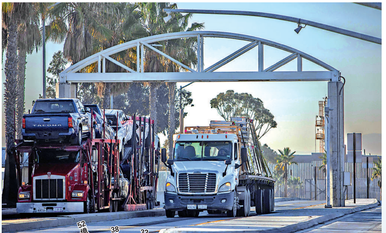
▲特朗普再次提出對進口鋼鋁加徵關稅。圖為運送鋼鐵產品的貨車從墨西哥進入美國。

特朗普在第一個總統任期內就曾呼籲徵收對等關稅。他的貿易和製造業高級顧問納瓦羅在撰寫「2025計劃」時提到，徵收對等關稅的首要對象是對美國貿易逆差較大、關稅稅率較高的國家，按優先順序排列分別是處於「紅色區域」的中國和印度；處於「黃色區域」的歐盟、泰國和越南等；以及處於第三梯隊的日本和馬來西亞。