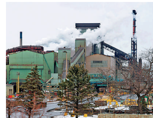
▲加拿大是美國進口鋼鋁產品的主要來源國之一。圖為加拿大一家鋼鐵工廠。

法國總統馬克龍9日說，歐盟必須做好應對特朗普關稅的準備。他警告美國說，如果對多個行業加徵關稅，將導致物價上漲，加劇美國通脹問題。