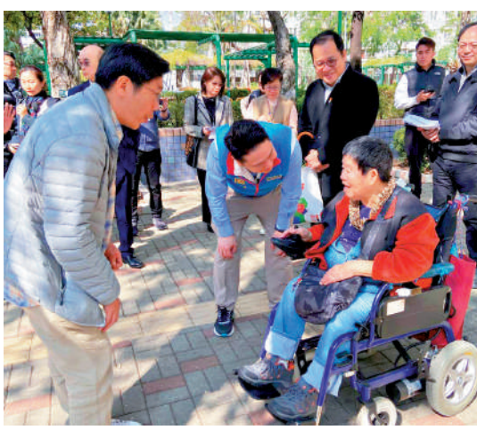
▲民建聯立法會議員周浩鼎，昨日約見房屋署官員，跟進屯門友愛邨輪椅人士友善配套狀況。

時輪椅人士在凹凸不平道路上行走的痛楚，署方透過今次幸福屋邨的計劃落實此事，相信亦可以為全香港其他老舊公共屋邨作示範。此外，周浩鼎表示，友愛邨頂層未安裝電梯，今次還與房屋署官員一同考察了在友愛邨頂層加設輪椅升降平台的可行性。署方表示，受制於消防規例的要求，未必能接納該建議。為此周浩鼎建議政府提供足夠措施，包括迅速調遷安排，以紓緩住在頂層行動不便長者的困苦。