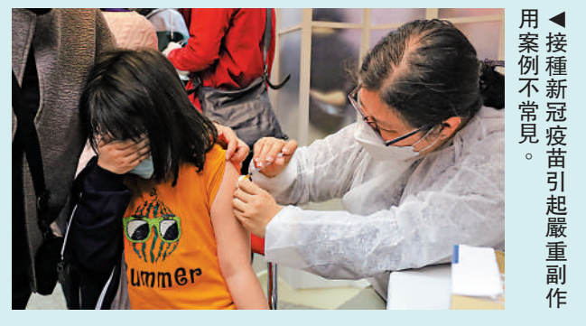
▲接種新冠疫苗引起嚴重副作用。

《香港醫學雜誌》指，全球已報告24宗接種新冠疫苗後出現皮膚炎的病例，其中2宗為中國患者，但均非來自香港。認識接種疫苗可能會有這後患及早發現皮膚炎引起的手指皮疹特徵，有助減少診斷和治療的延誤。