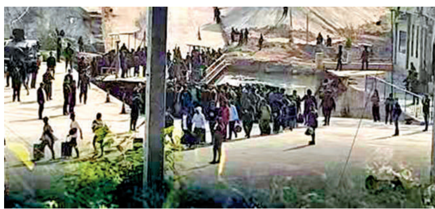
▲泰國媒體披露，緬甸方面12日向泰方移交數百名電詐受害者。圖為網上流傳的人員移交圖片。

泰方自2月5日起對緬甸的斷電、斷油、斷網措施，影響了妙瓦底的克倫邊防軍、民主克倫佛教軍和當地的電詐團夥。其中，小型電詐公司已選擇搬遷，大型電詐公司則降低業務量。