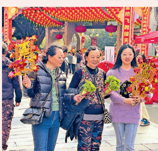
▲在佛山，市民遊客手持金色風車、生菜和葱，祈願順風順水。