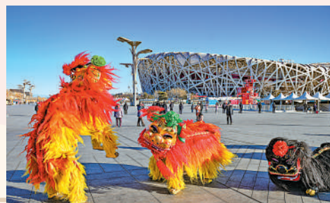
▲來自北京的白紙坊太獅舞表演吸引遊人目光。

在中國非物質文化遺產館裏，「過年——春節主題展」正在展出，從臘八節、小年、除夕、春節，到元宵節，各種過年習俗猶如一幅長卷徐徐展開，藝術化呈現與春節相關的非物質文化遺產代表性項