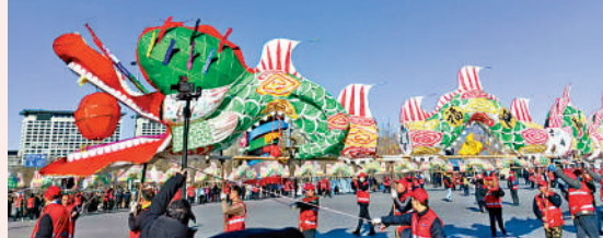
▲表演者沿途展示福建連城姑田遊大龍。