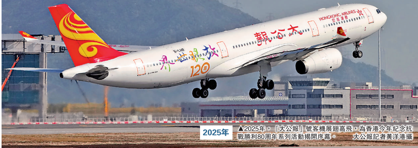
2025年，「大公報」號客機展翅高飛，為香港今年紀念抗戰勝利80周年系列活動揭開序幕。

2025年是世界反法西斯戰爭勝利80周年。《大公報》當年呼喚「航空救國」，募集資金購買「大公報」號滑翔機，並開設副刊《滑翔園地》，向公眾普及滑翔知識。近日，中國新聞史學會名譽會長、中國人民大學新聞學院副院長王潤澤教授接受《大公報》專訪表示，「大公報」號滑翔機升空，在抗日戰爭的特殊歷史背景下，是萬眾矚目的。滑翔現在是一項體育運動，但在當時是高科技的象徵，《大公報》作為中國媒體的中流砥柱和脊梁，積極發起和參與「航空救國」運動，極大鼓舞了抗日的士氣，這種不屈的意志可與代表國運的精神力量結合起來。