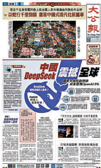
《大公報》深入報道DeepSeek相關消息，向世界傳遞中國科創實力。

「『大公報』號滑翔機升空更多的是一個儀式，起到了戰時鼓舞士氣的作用，大公報人苦心倡導滑翔運動，熱情助滑翔運動，顯示一片殷殷愛國之心。雖不是『唯武器論』，卻讓人提及武器時沒有陌生感，對抗戰必勝發揮了凝聚人心的作用。」王潤澤最後說。