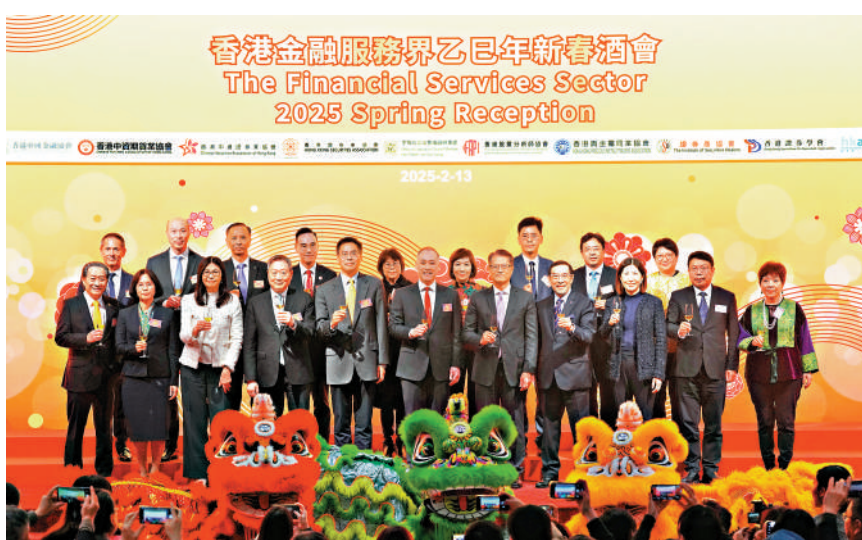
是次活動出席嘉賓還包括中央政府駐港聯絡辦副主任祁斌、中央政府駐港聯絡辦經濟部副部長呂峰、證監會行政總裁梁鳳儀、港交所行政總裁陳翊庭、香港中資證券業協會副會長林向紅、證券商協會主席朱李月華、香港黃金交易所主席張德熙，另還有多位立法會議員和金融服務界人士出席。

唐家成表示，特別感謝中央政府和特區政府在政策上的支持，同時也有賴業界共同努力，成功落實包括打風開市在內多項突破性的市場措施，為香港金融市場長遠發展奠定堅實基礎，新的一年，港交所會繼續在多方面推動市場發展，包括開發多元化的產品服務、提升上市機制，確保香港市場緊貼國際潮流，繼續發揮連通中國和世界的重要角色，未來希望能有更多機會和持份者交流、合作。