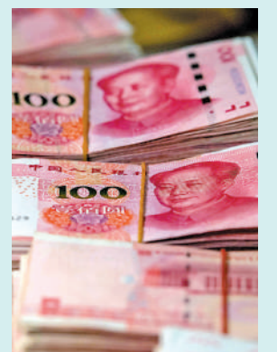
▲國家財政部在港發行的125億元人民幣國債，共有5個系列。

財政部將使用中央結算系統債券投標平台(CMU)為國債進行招標，在競價投標中獲接納的最高中標利率，將被定為相關系列國債的利率。投標日為2月19日，2月21日交收。