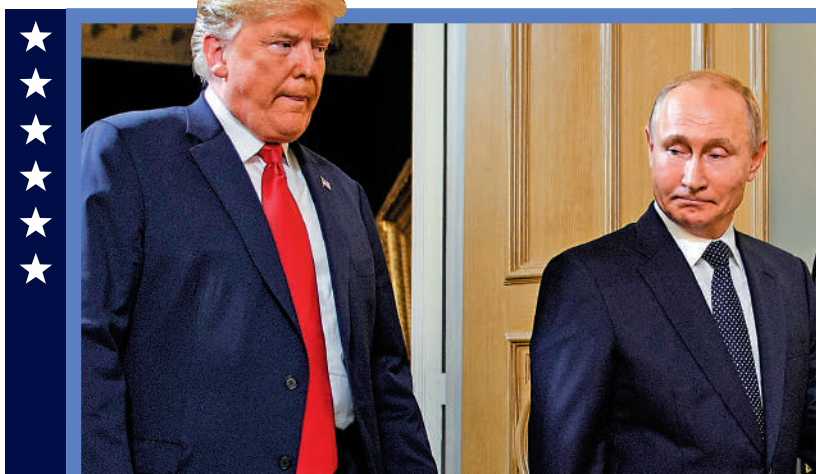
▲2018年7月，時任美國總統特朗普（左）在赫爾辛基與俄羅斯總統普京會晤。