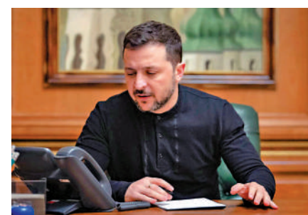
▲烏克蘭總統澤連斯基12日與特朗普通電話。

特朗普與普京就解決俄烏衝突直接通話，令烏克蘭和歐盟國家集體陷入「混亂和不知所措」。澤連斯基13日表示，他相信烏克蘭是特朗普的優先考量，但「無論如何，美國領導人先打電話給普京，真的令人不太愉快」。他指出，在與俄方舉行會談之前，他希望與美國就「對抗普京」的立場達成一致。他還說，不接受任何