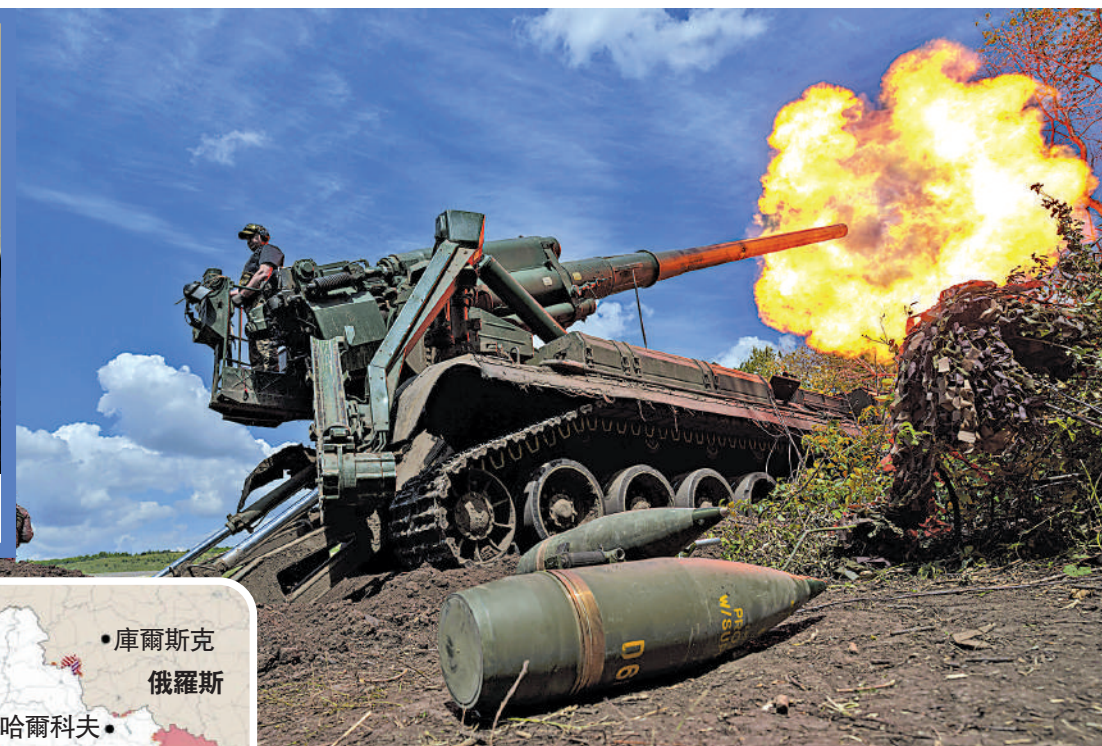
▲俄烏衝突持續近三年。圖為烏克蘭士兵在頓涅茨克前線向俄軍陣地發射榴彈炮。