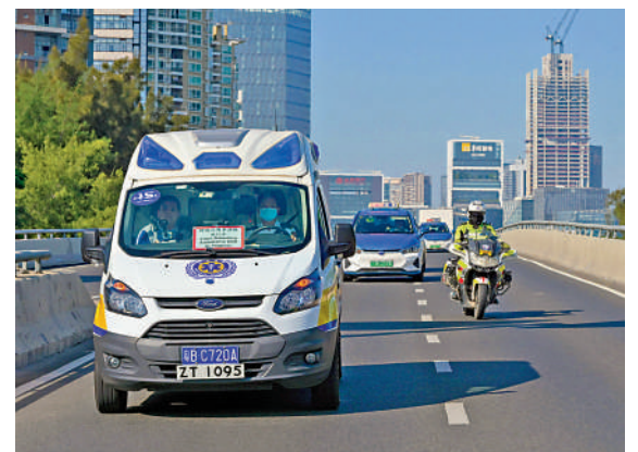
▲醫管局昨日公布，瑪嘉烈醫院當天接收第三名參與「大灣區跨境直通救護車試行計劃」的病人，由跨境直通救護車以點對點方式從澳門運送到香港接受治療。 資料圖片

《粵港澳大灣區發展規劃綱要》提出研究開展非急重病人跨境陸路轉運，探索在指定公立醫院開展跨境轉診合作試點。行政長官也在2023年施政報告中提出要探討粵港澳大灣區醫院之間救護車跨境轉運病人的安排。在國家多個部委的鼎力支持和指導，以及粵港澳三地政府部門的共同努力下，試行計劃在去年11月30日正式啟動，並分別於今年1月10日及1月27日成功從深圳運送首名及第二名病人返回香港接受治療。