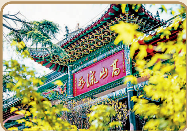
為紀念「高山流水遇知音」的故事而建的古琴台。

三鎮中的漢口，如今已不屬於單一行政區劃，而是包含江岸、江漢、礄口三區。地域內除了中國現存最早的三座海關大樓之一的江漢關大樓，還有黎黃陂路周邊的許多精美古建築，是遊客了解武漢歷史文化的絕佳去處。