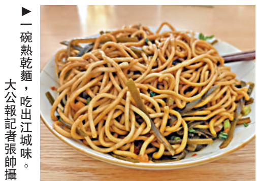
一碗熱乾麵，吃出江城味。

將碱麵條放進沸水裏燙熟撈出，拌以特製的芝麻醬、胡椒粉、麻油、滷水等各式調料，再撒上蔥花、醃蘿蔔、酸豆角拌一拌，搭配出獨特口感，讓人大呼過癮。豆皮也是武漢人的過早標配，它不是北方的豆腐皮，而是用米漿或綠豆漿攤製而成，烙得焦香微脆，中間再鋪上一層糯米、肉丁、鮮蛋、香菇丁、鮮蝦仁，層層疊加後翻捲壓實，外皮酥香，內裏柔軟。