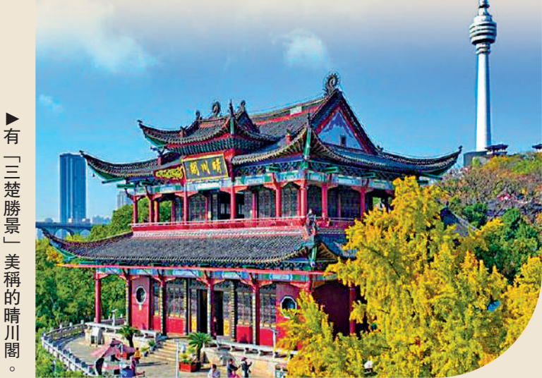
有「三楚勝景」美稱的晴川閣。