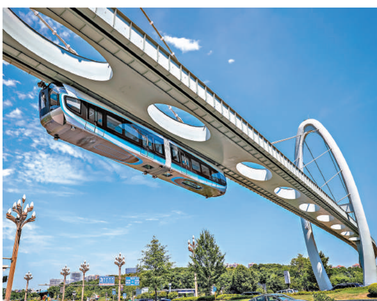
「光谷光子號」空軌列車凌空越過。