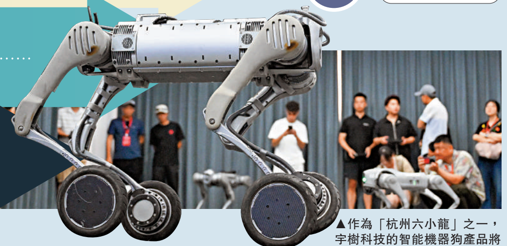
▲作為「杭州六小龍」之一，宇樹科技的智能機器狗產品將業界標準推向新高度。