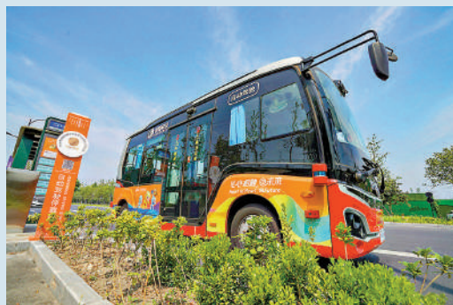
▲杭州早在前年開通首條自動駕駛公交路線，至今已發放逾五百張測試與應用牌照。

「我們現在有15項專利在手，接下來想通過質押方式進行融資。」他告訴大公報記者，「目前市場抵押融資利率大約在2.7%左右，還是需要足夠額度的抵押物為前提，這次高新區發行的產品，企業實際融資利率僅為1.43%，期限為1年，明顯低於市場報價利率。」