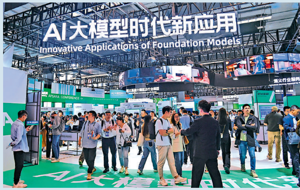
▲杭州孕育出撼動全球的DeepSeek，創科界爭相「解碼」其成功要訣。圖為以「計算，為了無法計算的價值」為主題的2023雲棲大會在杭州雲棲小鎮開幕。