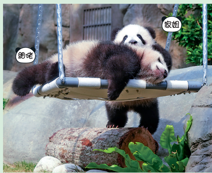
「家姐」「細佬」萌態十足的互動，引起現場眾記者歡笑，抓足眼球。