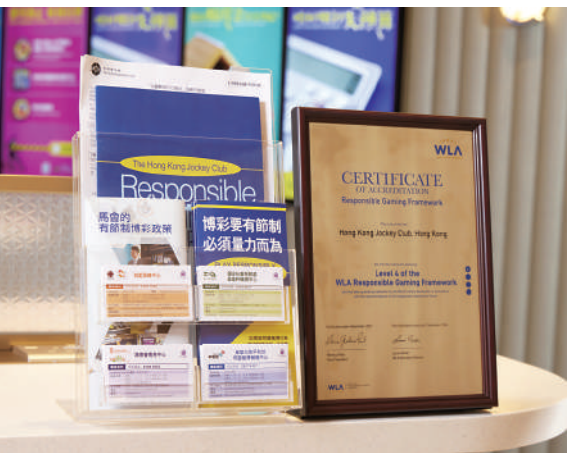
▲馬會捐助「平和基金」提供有節制博彩教育，以及輔導與治療服務，並進行與賭博相關的研究和分析。