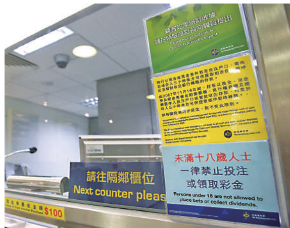
▲馬會只容許年滿18歲的人士參與博彩活動。