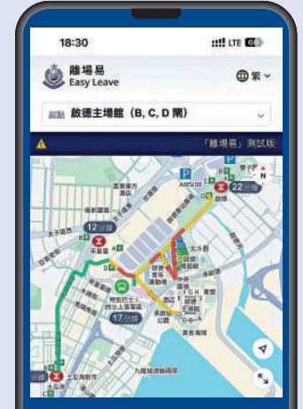
昨晚演練結束後的30分鐘，「離場易」顯示體育園內的路面情況大多處於黃色及紅色的擁擠水平。