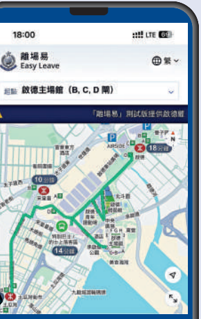
昨晚6時演練結束前一刻，「離場易」顯示體育園內的路面情況處於綠色的正常水平。

當局於演練期間，還邀請香港童軍樂隊、港島地童軍樂隊、創知中學、保良局雨川小學等為公眾舉行「步履匯演樂全城」的樂器演奏會。首批演奏者入場後在場館中央吹響樂器，其餘樂隊則在場館四周緩緩進場，雖然大部分表演者是青少年，但他們演奏水平不俗，獲得不少觀眾鼓掌與喝彩。