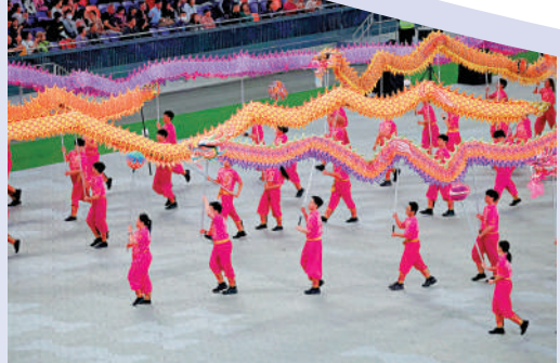
▲近百人參與舞龍活動。

體育專員蔡健斌透露，開幕將有盛大及隆重的典禮，會有體育、文化、演藝人士參與的表演，陣容會「跨年齡、跨世代」。