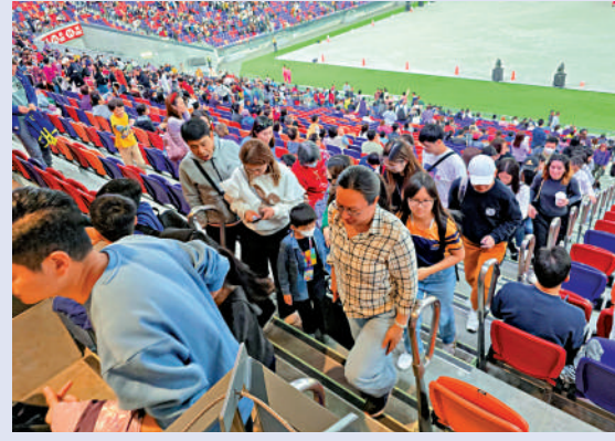
觀眾有序地離開場館。

啟德體育園將於3月1日開幕。園區昨午舉行開幕前最後一次演練，共有逾50000人參與，主要測試體育園和周邊設施在舉辦最高可容納人數綜藝活動時的承載能力，以及進場、離場和相關公共運輸配套安排。昨天亦首次使用人工智能(AI)進行實時數據分析的平台「離場易」，幫助離場觀眾了解散場人流。據悉，最高峰時有約10000人使用「離場易」，觀眾大約40分鐘便離開體育園區。到場視察的政務司司長陳國基建議市民未來更多地使用「離場易」。