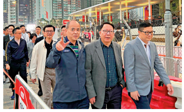
▲政務司司長陳國基(前排右二)與保安局局長鄧炳強(前排右一)昨到體育園視察演練。

是次演練同時使用體育園內全部3個場館，逾50000名公務員和公眾人士參與，年齡層亦更多樣化，有助檢視並優化日後的進場及離場安排。