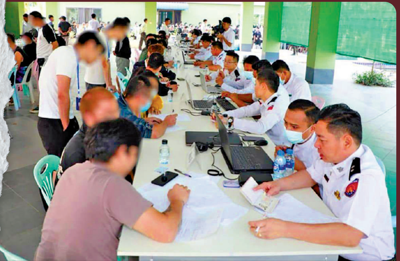
▲緬甸警察、移民局等人員，正為電詐園區內救出的人員進行登記、拍照、核實國籍及入境紀錄。

另一名泰國「豬仔」說，有騙徒向其謊稱可提供一份在水溝谷的高薪工作，月薪30000泰銖，他不虞有詐自行乘巴士往湄索。在另一名泰國男子接應下，他與其他「豬仔」被帶至河邊，一起被偷運到河對岸的園區。據緬甸及泰國的調查發現，有泰國人參與拐帶「豬仔」到電詐園。