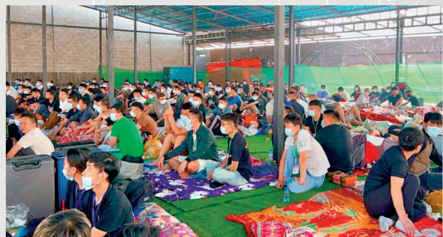
▲一批獲救的「豬仔」暫時安置在妙瓦底的軍方設施內。