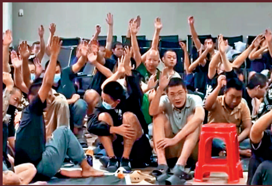
▲電詐團一幢大樓內獲救的大批「豬仔」，全部舉手表示想回國。