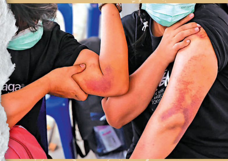
▲獲救的電詐團「豬仔」展示被虐待傷痕。

另外，有泰國網民在報章「豬仔」獲救新聞下方用泰文留言：「如果不是中國政府出手相助，都不知這些（豬仔）可以怎麼辦？當地的省長、區長、警察局、移民局、外交部、內政部、旅遊部、軍方，全部無人關心事件，一直未發現問題，真為自己國家的狀況痛心。」