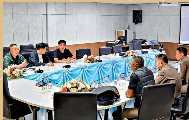
▲中國與泰國警方昨日繼續開會，商議押送「豬仔」安排細節。