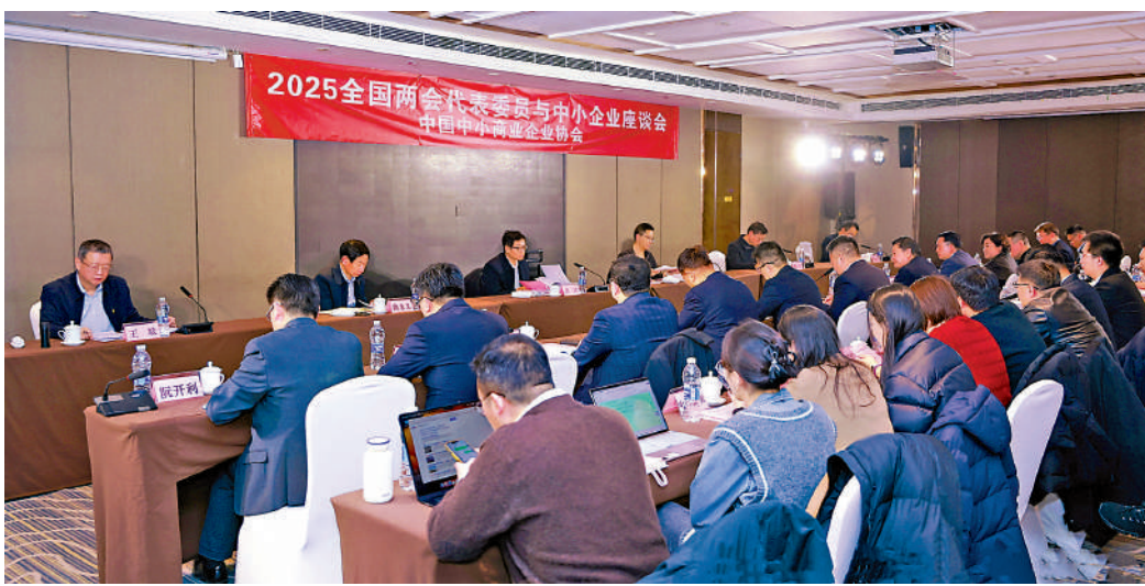
▲2025全國兩會代表委員與中小企業座談會18日在京召開。