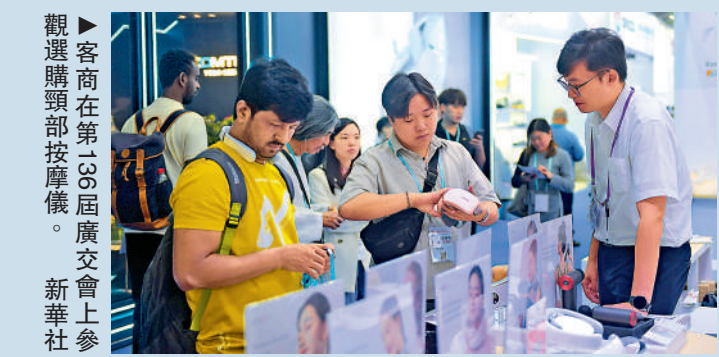
►客商在第35屆廣交會上參觀選購頭部按摩儀。

支持中小企業講好品牌故事，打造具有文化內涵和視覺吸引力的品牌形象，依託港澳地區國際化資源，助內地中小企業出海。 大公報記者任芳頡、郭瀚林整理