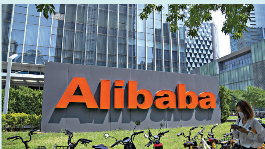
▲新一輪AI大戰展開，AI to C成為阿里巴巴關鍵戰略，集團近期大規模招聘相應職位。

根據內地《人形機器人產業研究報告》數據顯示，2024年中國人形機器人市場規模約27.6億元人民幣，到2030年有望進一步打造成為「千億元市場」。