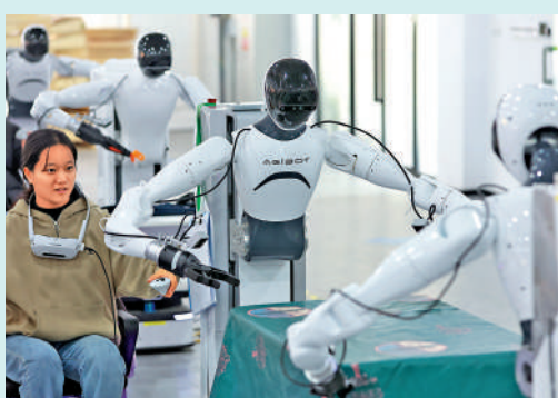
▲智元新創的人形機器人實現大規模量產。