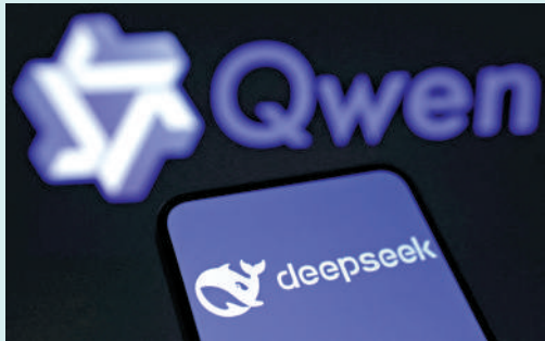
▲阿里的語言大模型「通義千問」與DeepSeek。