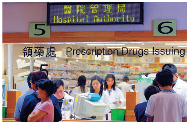
▲再有兩款新藥在「1+」藥物審批機制下獲批准在港註冊，為病人提供更多選擇。

【大公報訊】再有兩款新藥在「1+」藥物審批機制下獲批准在港註冊，政府發言人昨日表示，該兩款藥物用於治療局部晚期或轉移性的非小細胞肺癌，能