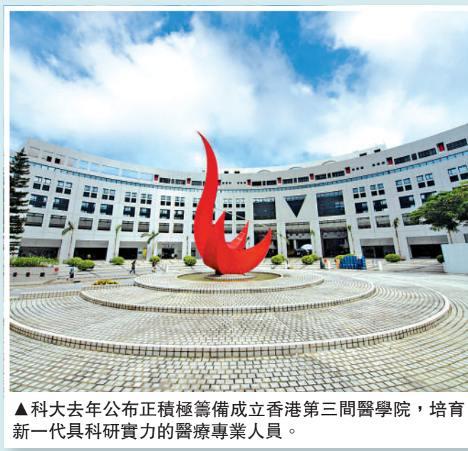
▲科大去年公布正積極籌備成立香港第三間醫學院，培育新一代具科研實力的醫療專業人員。