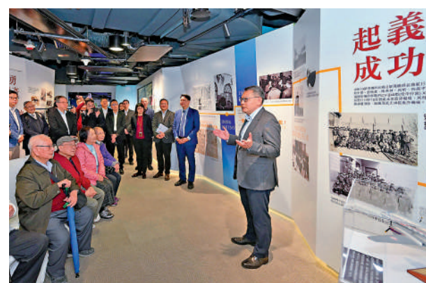
▲民航處航空教育徑增設以「兩航起義」及國家民航發展為主題的展覽廳，昨日起開放參觀。

航空教育徑每日設有兩團導賞團，供公眾免費參觀。可供預約時段為星期一至五（公眾假期除外）上午10時至11時30分及下午2時至3時30分。