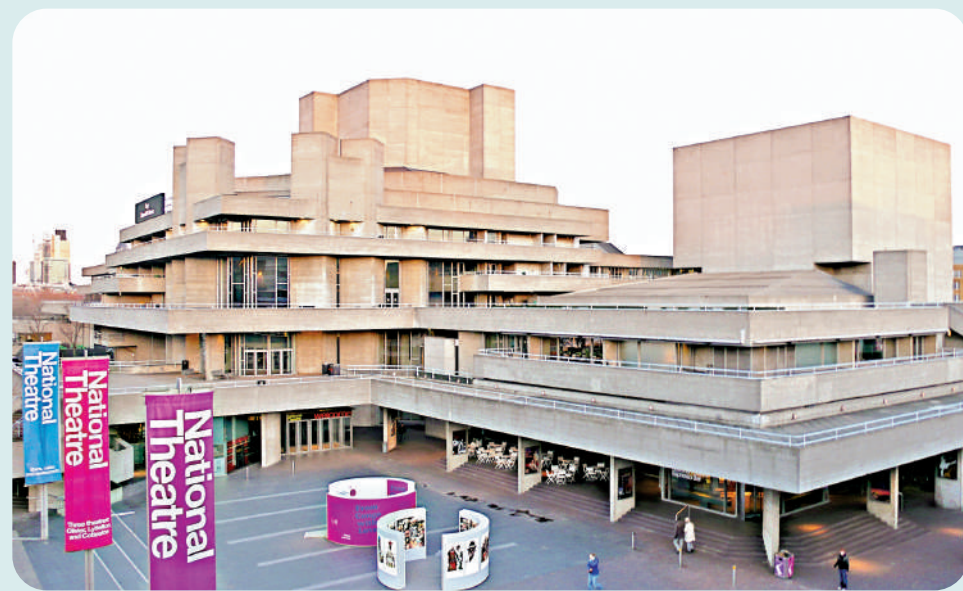
▲英國皇家國家大劇院（Royal National Theatre）是粗獷派標誌性建築。資料圖片

和磨損，大大降低了美學效果，還包括部分社區建築開始與犯罪和貧困等社會問題聯繫在一起，像是電影《發條橙》（A Clockwork Orange）中的黑幫混混，經常出沒於粗獷派建築群。英國作家西奧多·達爾林普爾甚至將這些建築描述為「不人道、怪誕和冷酷」，因為它們不會優雅地老化。