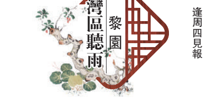
黎園 灣區聽雨 逢周四見報

着科技持續進步完善，這些難題終將逐一破解。「未來診館」作為醫療領域的創新先鋒，必將在未來為人類健康事業立下赫赫戰功，成為守護生命的堅固壁壘。