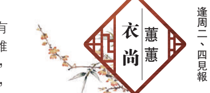
衣蕙 逢周二、四見報

特別是節日經常作濃妝的臉容，普通的潔膚程序可能沒有徹底清潔。而各人不同的膚質，在潔膚方面也要用正確的方法，例如去角質，油性肌膚較易出油，使用方式與乾性肌膚不同，要能夠有效幫助皮膚控油。乾性肌膚則需要有助皮膚保濕，同時還要加強肌膚的鎖水功能。 每次清潔臉容，除了視乎美妝品的濃度外，緊記要以輕柔的方式，每次潔膚後，護膚品要用輕按的手法塗抹，女士們勿輕視此步驟，這對膚質影響很大，美肌的重要因素就在於日常對肌膚的細心護理。