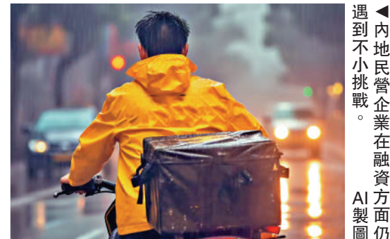
清科研究中心的數據顯示，2023年中國投資市場共發生案例數9388宗，同比下滑11.8%；披露投資金額6928.26億元人民幣，同比下滑23.7%，連續兩年下滑。（見配圖）

觀察與會企業背景可發現，名單涵蓋人工智能、高端製造、信息通信、人形機器人、航空航天等諸多高科技領域。可以說，既是產業革命的主戰場，也是中美博弈的熱廚房。