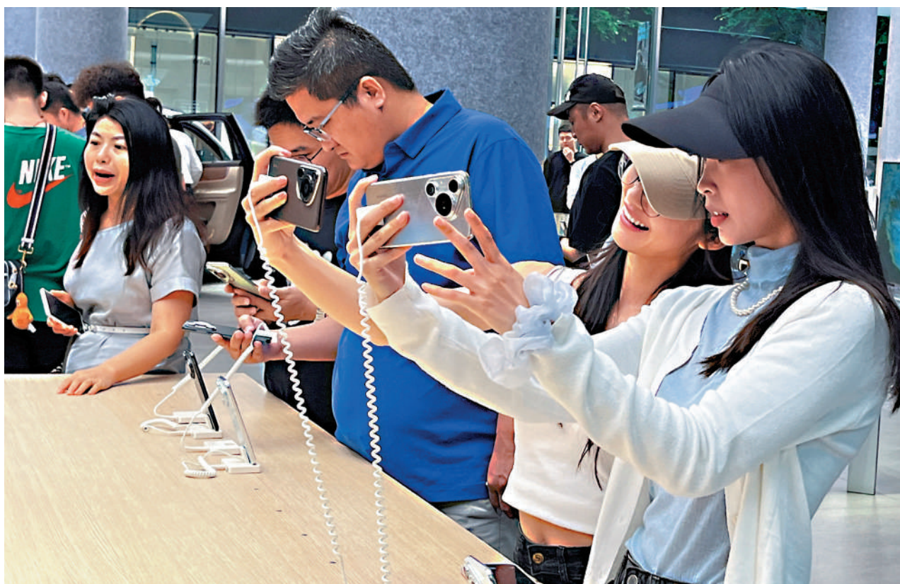
▲民營企業已經成為中國創新的主要來源，華為、比亞迪、大疆、深度求索等民營創新公司的成果，增強了中國經濟參與國際競爭的底氣。圖為深圳華為專門店內，市民選購心儀的手機。