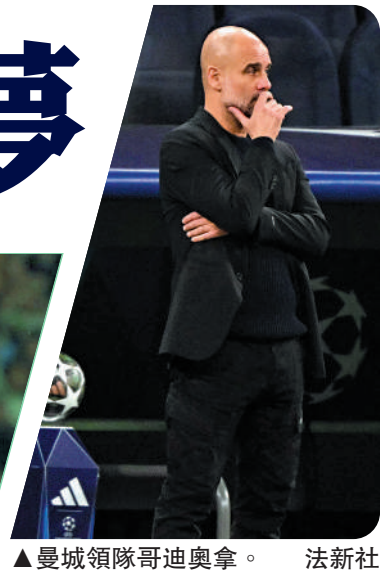
▲曼城領隊哥迪奧拿。

前兩圈面對低級別對手順利過關，16強主場遇英冠下游普利茅夫，可望順利過關，而球隊就只餘下是項錦標可爭，相信絕不會掉以輕心。