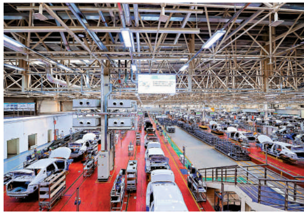
▲廣州今年將大力推動汽車產業向「電動化、智能化、國際化」轉型。

對於正面臨產業轉型和智能化升級的迫切需求的廣州來說，AI技術、機器人在製造、醫療、金融等領