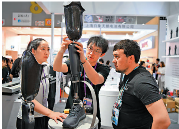
▲外國採購商在第135屆廣交會強腦科技展參觀看智能仿生腳。

廣州市九三學社提交了《關於推動廣州市人形機器人產業發展 搶佔通用型人工智能新高地的提