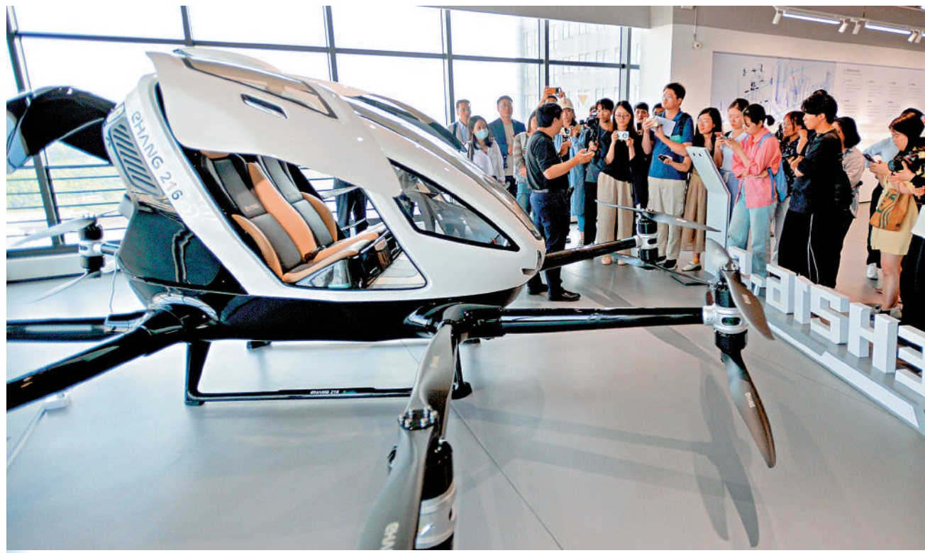
▲2025年，廣州將投入逾140億元人民幣部署全過程創新產業鏈。圖為廣州億航智能工作人員向參觀者介紹EH216-S載人級無人駕駛飛行器。

2025年是「十四五」規劃收官之年，廣州今年GDP增速目標定為5%。根據廣州財政預算顯示，廣州今年將推進998個重點項目，完成投資3815億元，以政府投資帶動社會投資。