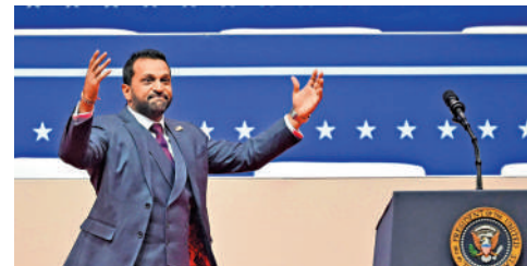
▲特朗普「鐵粉」帕特爾出任FBI局長。