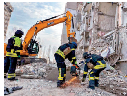
▲烏克蘭赫爾松地區20日遭俄羅斯空襲，救援人員在倒塌的居民樓旁工作。

俄烏衝突升級後，作為對俄制裁的一部分，西方國家凍結俄羅斯大約3000億美元海外資產，其中歐盟凍結了俄羅斯央行價值超過2170億美元的