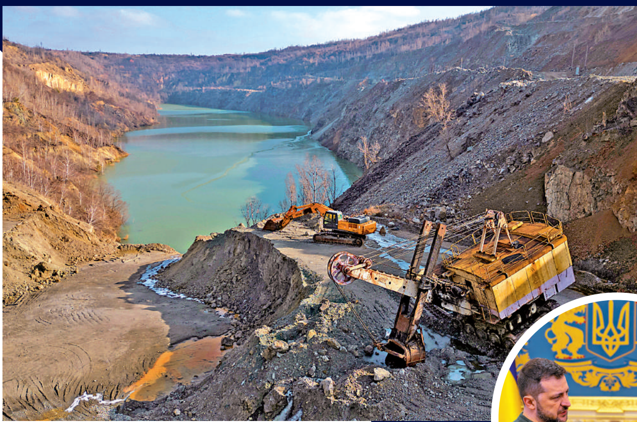
◀位於烏克蘭扎瓦利亞地區的石墨露天礦場。