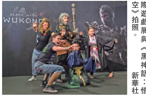
▲人們在德國2024年科隆國際遊戲展與《黑神話：悟空》拍照。