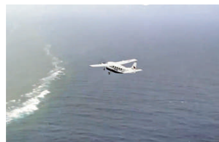
▲2月18日，菲律賓飛機非法闖入中國黃岩島領空。

中國南海研究院區域國別研究所所長丁鐸在接受《大公報》訪問時表示，隨着菲律賓中期選舉日益臨近，馬科斯政府正以在南海挑起事端贏得選民支持。去年11月菲律賓簽署所謂