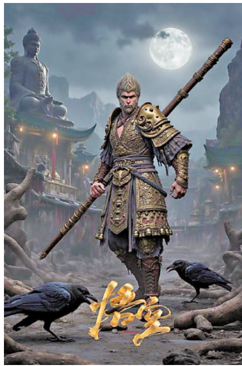
▲《黑神話：悟空》橫掃全球遊戲榜單，深受中外玩家歡迎。

美術團隊創造性地将宋代水陸畫、晉城玉皇廟二十八宿彩塑數字化，構建出獨樹一幟的東方魔幻美學體系，這些成果都源自無數次「試錯」積累的量變。