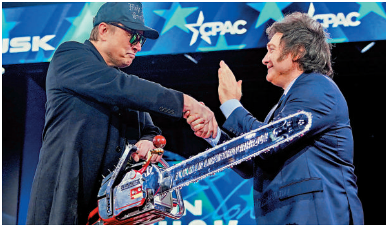
▲阿根廷總統米萊（右）向馬斯克贈送一把「標誌性」電鋸。

如此雷厲風行的裁員風暴，很容易讓人聯想到米萊在阿根廷推動的「電鋸革命」。早在該國上一輪大選期間，米萊高舉電鋸的畫面已成為競選宣傳的經