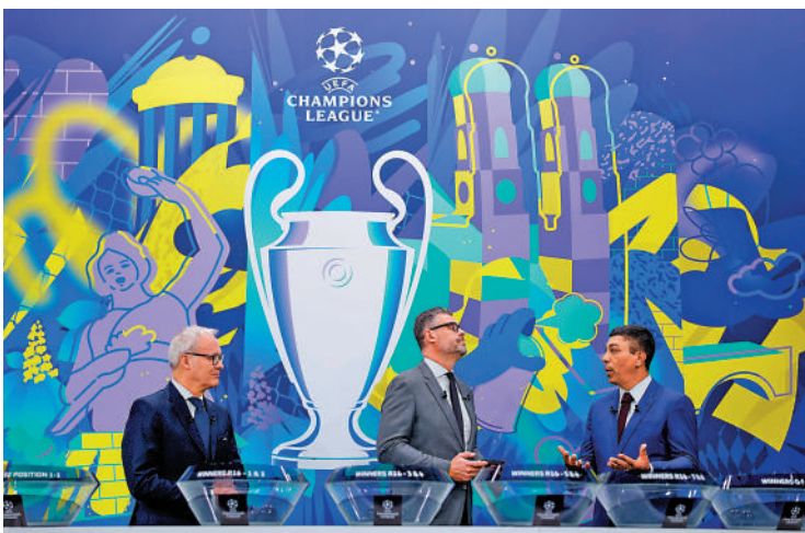
歐聯抽籤儀式現場。