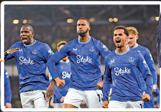
愛華頓基本上已脫離護級漩渦。