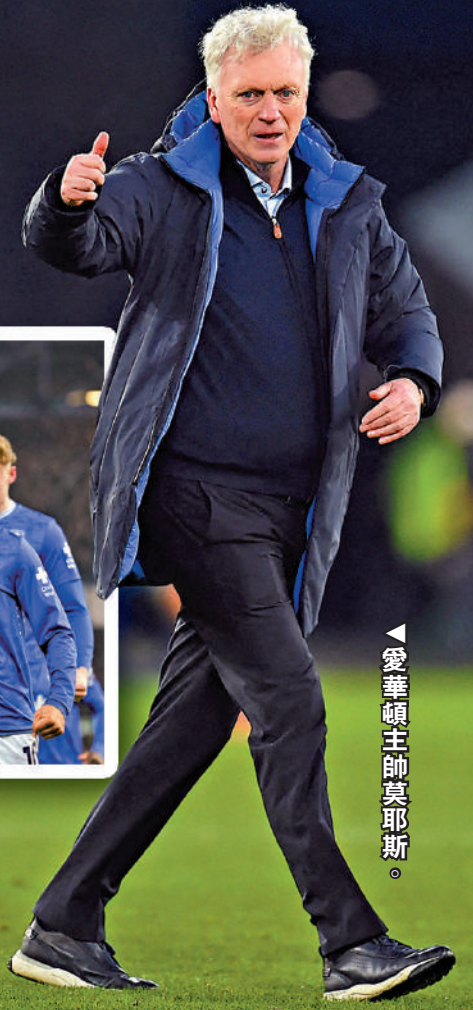
愛華頓主帥莫耶斯。