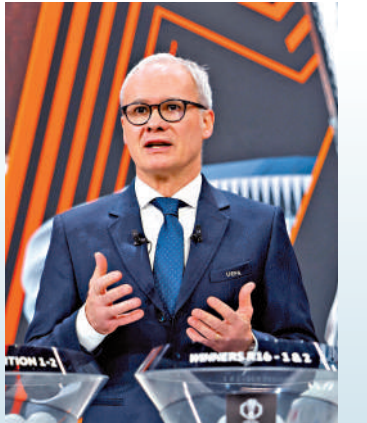
歐霸抽籤儀式現場。

歐聯16強同時亦完成抽籤，奪標大熱車路士對手是丹麥哥本哈根，與車路士同線路的只有如莫迪、維也納迅速等3、4線球隊，車路士躋身決賽實在毫無難度。相反另一邊就包括連續兩屆殺入決賽但都屈居亞軍的費倫拿、有曼聯「翻生借將」安東尼馬菲奧斯助拳的貝迪斯、希臘勁旅彭拿典奈高斯幾支實力球隊，且看誰能挑戰車路士。