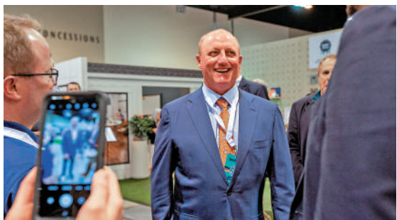
▲阿貝爾將接替股神成為巴郡新任行政總裁。

加拿大阿爾伯塔大學(University of Alberta) 畢業，獲得商學學位，之後任職會計師。