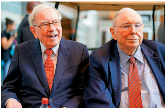
▲已故的芒格(右)是巴菲特的最佳拍檔。