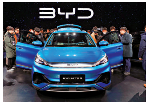
▲巴郡早年投資比亞迪獲利甚豐。

然而，因着美國政府不斷打壓中國企業，巴郡為規避風險，遂在2022年8月開始分段減持比亞迪。直到2024年7月16日，巴郡以每股平均價246.96元，減持逾139萬股比亞迪股份，令到持股降低至4.94%。由於巴郡並無進一步披露處理剩餘比亞迪股份的資料，市場估計，巴菲特今次投資比亞迪，獲取利潤550億至600億元。