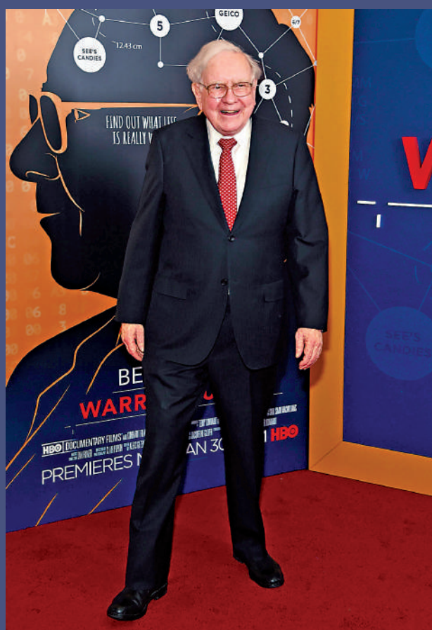
▲股神巴菲特即將退任，其投資心得是不少人的座右銘。