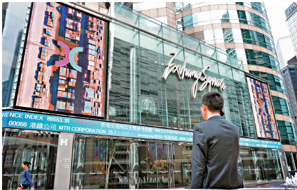
香港優化互聯互通機制，包括在香港推出離岸國債期貨，並盡快落實引入股票大宗交易。

在市場結構方面，港交所（00388）將從年中起逐步為其交易後系統引入新功能並進行系統升級，以確保年底前在技術上兼容T+1結算周期，為縮短結算周期作好準備。同時，港交所與證監會將在年內就改善交易單位制度（即俗稱「手數」制）提出建議，使交易安排更符合不同股份的流動性特