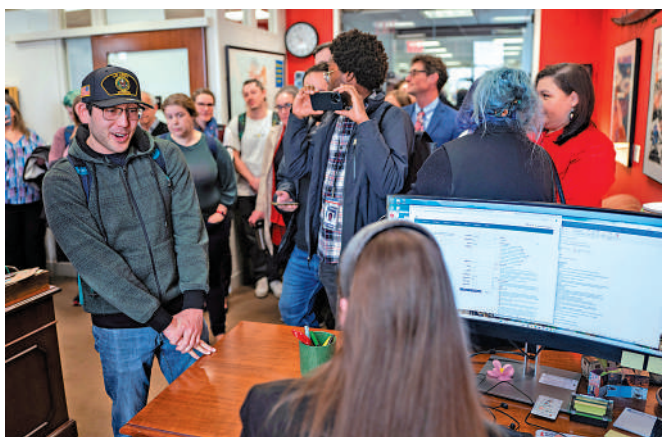
▲示威者25日在議員辦公室抗議馬斯克的裁員行動。

25日，白宮宣布任命艾米·格林森為美國政府效率部代理主管。據介紹，格林森曾在特朗普首屆政府中任