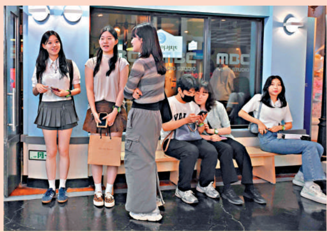
▲示威者25日在議員辦公室抗議馬斯克的裁員行動。