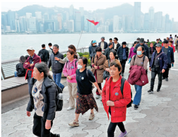
透過加強推廣一系列特色旅遊項目等措施，特區政府預計可吸引額外約18.3萬旅客人次訪港，帶來約14億元消費。