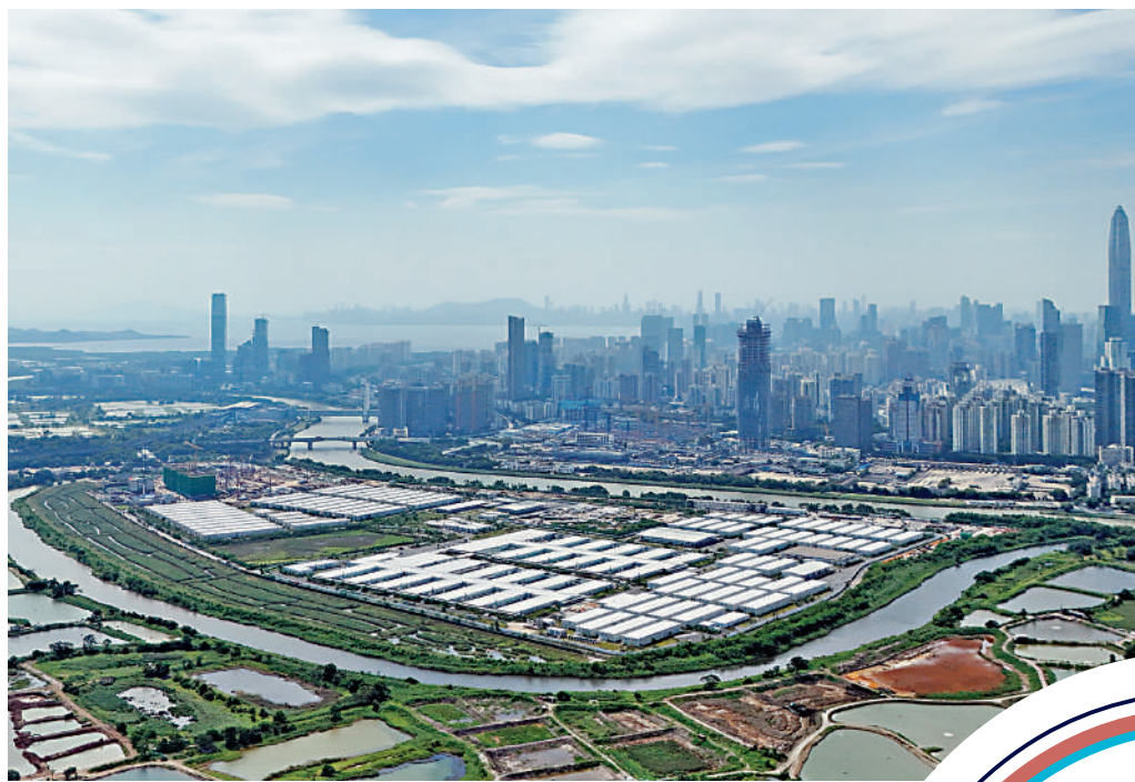
特区政府已預留37億元，加快完成河套合作區香港園區第一期的基建及公用設施。

隨着北都及其他與經濟民生相關的基建工程陸續展開，政府中期財政預測的基本工程開支，由去年預計平均每年約900億元，增至未來五年平均每年