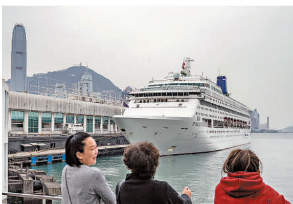
特区政府已預留資源，加強支援鼓勵郵輪公司增加訪港航次、過夜停泊，以及利用香港作母港。