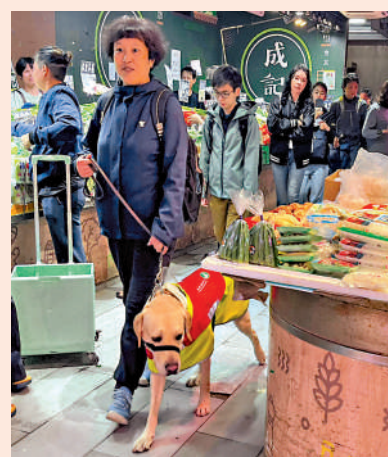
▲導盲犬在公共場合接受考核。

未經導盲犬使用者同意，切勿任意觸摸、輕撫或干擾工作中的導盲犬。不要以聲音或手勢吸引導盲犬的注意。