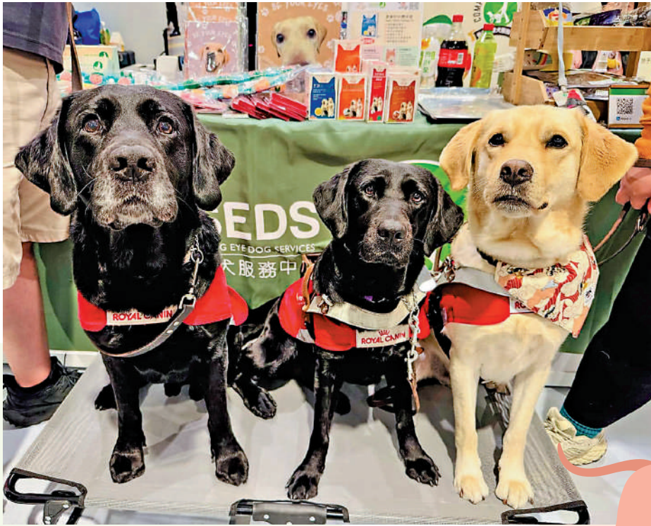
▲三隻導盲犬現身「香港寵物節」。

在香港，除了導盲犬外，還會有助聽犬、社交信號犬、腦癱應變犬等不同類型的工作犬，幫助聾人及弱聽人士、自閉症患者、腦癱發作人士更好地生活。在訓練之外，牠們則與一般寵物犬無異，會在寵物公園或是草地上盡情玩耍。