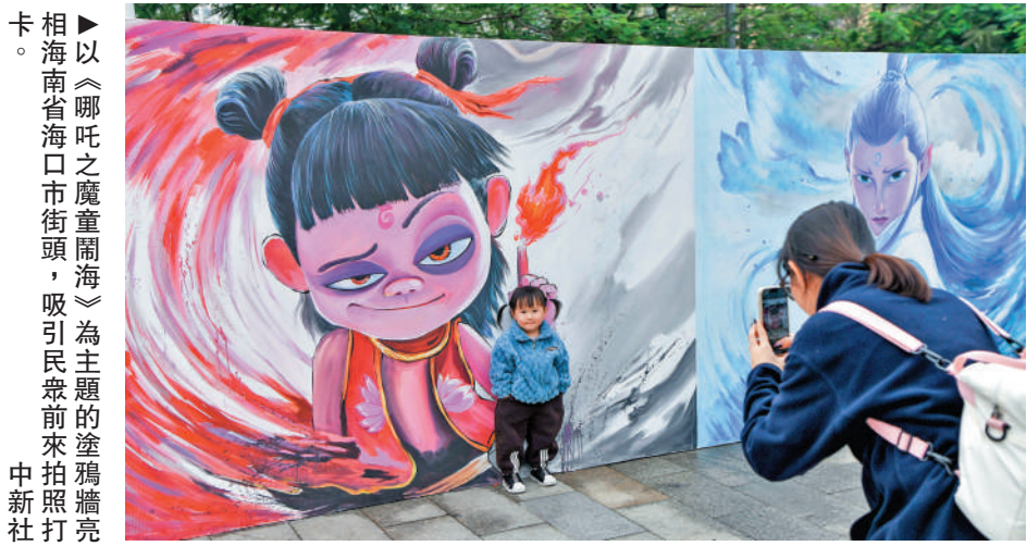
卡相▶以《哪吒之魔童鬧海》為主題的塗鴉牆，吸引民眾前來拍照打卡。

好電影自然有吸引力，《哪吒2》目前已經成為全亞洲首部過百億、闖進全球影史票房榜前八的現象級華語影片。在2月26日的國台辦例行新聞發布會上，發言人朱鳳蓮回應記者提問表示，有近40萬條台灣網友評論呼籲盡快在台灣上映這部電影，我們希望台灣有關方面傾聽民眾呼聲，讓更多優秀大陸電影進入台灣影院，讓台灣同胞能欣賞更多優秀文化產品。