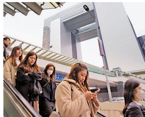
▲公務員凍薪決定是基於連續兩年經濟增長、私人市場加薪趨勢及強化財政整合計劃等因素考慮。