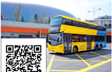
▲城巴開辦五條特別路線，接駁啟德體育園方便觀眾離場。 掃一掃有片睇