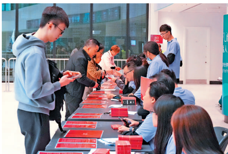
▲啟德體育園開幕禮門票昨日換領，秩序井然。

有炒家揚言，取票後門票上不設實名，買家可以放心持票入場。警方提醒市民，根據《公眾娛樂場所條例》，轉售炒賣門票屬違法，一經定罪可處罰款2000元。