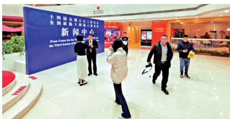
▲2月27日，全國兩會新聞中心正式啟用。圖為新聞中心新聞發布廳。