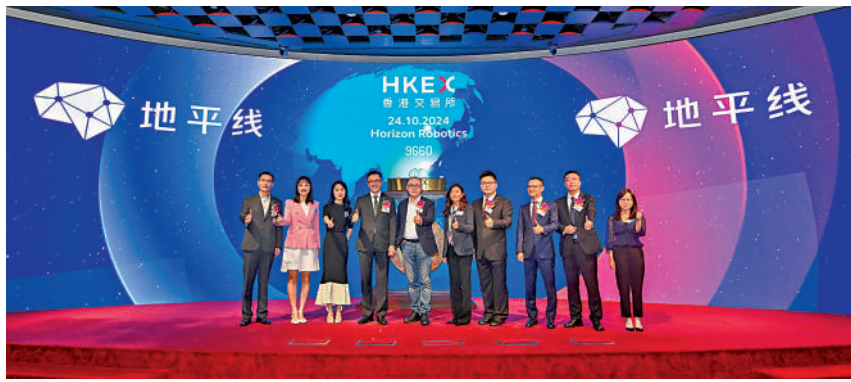
升掛牌上市後，地平線機器人自去年10月在港上市後，股價表現節節上

因此，新一份財政預算案中繼續在創科之上投入更多資源，堅持投資未來、發展經濟的大方向正確。雖然本財