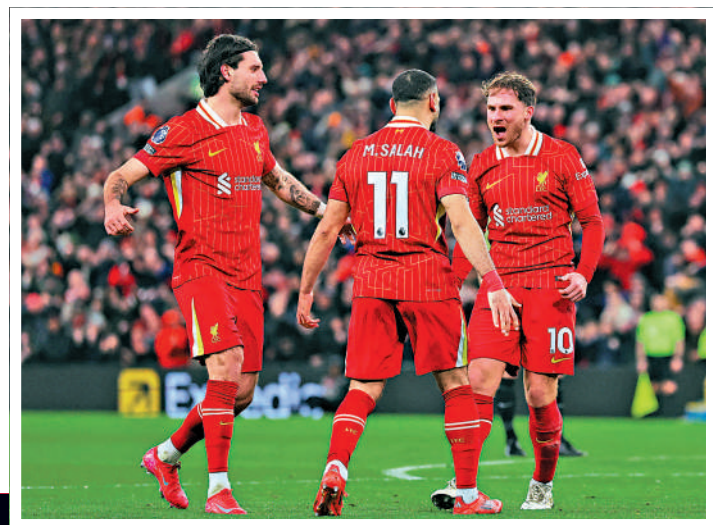
▲麥亞里士打(右一)與沙拿(右二)慶祝入球。