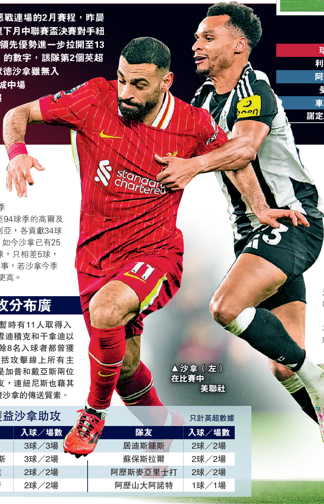
▲沙拿(左)在比賽中。

利當季20次全屬非死球助攻的紀錄。還有的是，英超史上入球助攻的「入球貢獻」單季最高紀錄，爲1993至94球季的高爾及1994至95球季的舒利亞，各貢獻34球和13次助攻共47球，如今沙拿已有25球和17次助攻共42球，只相差5球，而且該兩季有42輪賽事，若沙拿今季破紀錄的話含金量就更高。