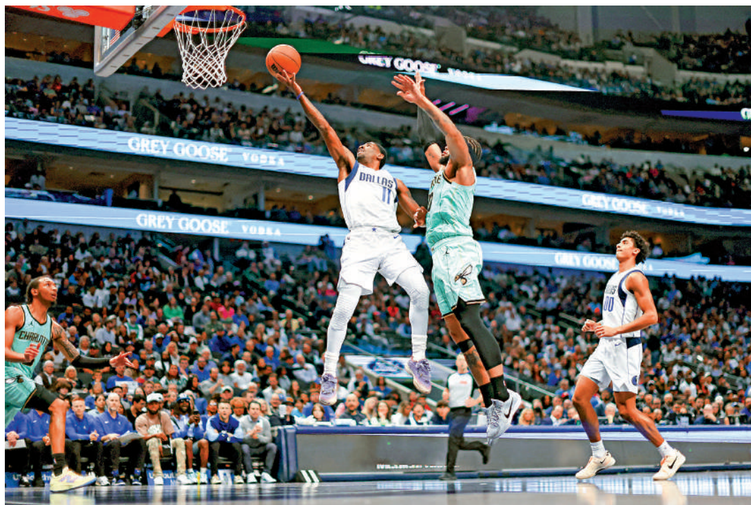
▲消息指籃球博彩最快可在明年秋季推出，初步計劃納入NBA、WNBA等賽事，但不包括本地賽事。