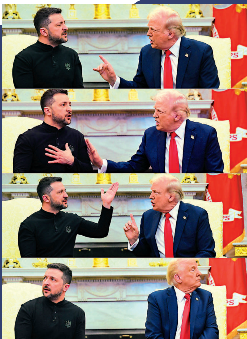
▲美國總統特朗普與到訪白宮的烏克蘭總統澤連斯基爆發激烈罵戰。