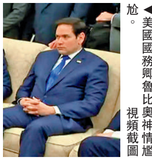
▲美國國務卿魯比奧神情尷尬。視頻截圖

澤連斯基3月1日已飛抵英國倫敦，準備參加2日由英國首相斯塔默主持的一場歐洲領導人峰會，討論結束俄烏衝突等話題。他1日發文重申烏方已準備好簽署礦產協議，但也持續呼籲美國提供安全保障。（綜合報道）