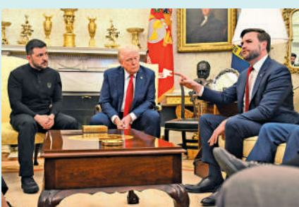
▲美國副總統萬斯（右）指責澤連斯基。