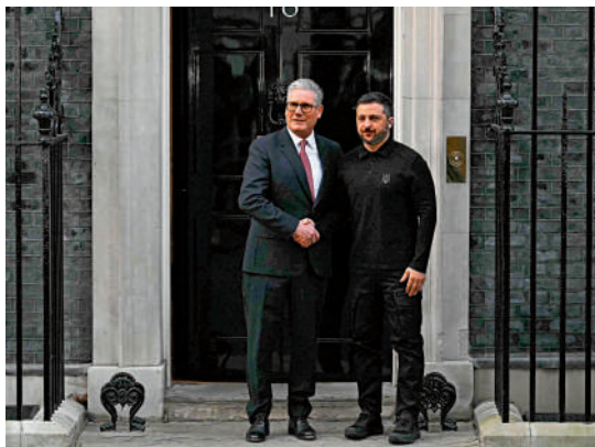
▲澤連斯基（右）1日在唐寧街與斯塔默會面，斯塔默重申對烏克蘭的支持。

歐洲內部並非鐵板一塊。歐盟特別峰會將於6日召開，峰會聯合聲明草案稱，沒有烏克蘭的參與就不可能就烏克蘭問題展開談判，和平協議