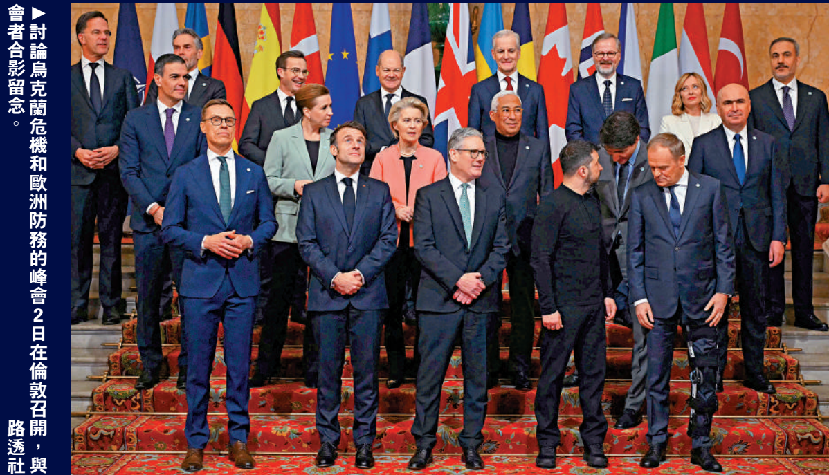
▶討論烏克蘭危機和歐洲防務的峰會2日在倫敦召開，與會者合影留念。

美烏總統在白宫「談崩」之後，美國的歐洲盟友上演政治秀，力撐烏克蘭總統澤連斯基。英國首相斯塔默先與澤連斯基在倫敦會面後，又宣布英烏簽署22.6億英鎊（約221億港元）的貸款協議。當地時間2日，歐洲多國領導人在倫敦舉行安全峰會，討論烏克蘭危機和歐洲防務問題。有分析指出，一個不團結且在防務上依賴美國的歐洲，在烏克蘭問題談判中掌握的籌碼有限。