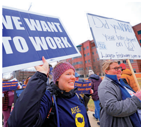
▲被解僱的NOAA員工2月28日在底特律參加抗議活動。

特朗普讓馬斯克牽頭「政府效率部」（DOGE）推進裁員行動，而馬斯克旗下的太空探索技術公司（SpaceX）近年發射了大量衛星，被批評霸佔軌道、增加碰撞風險。路透社指出，馬斯克長期以來一直指責太空法規過時。此次裁員還影響到NOAA核發商業圖像衛星許可的核心職能。