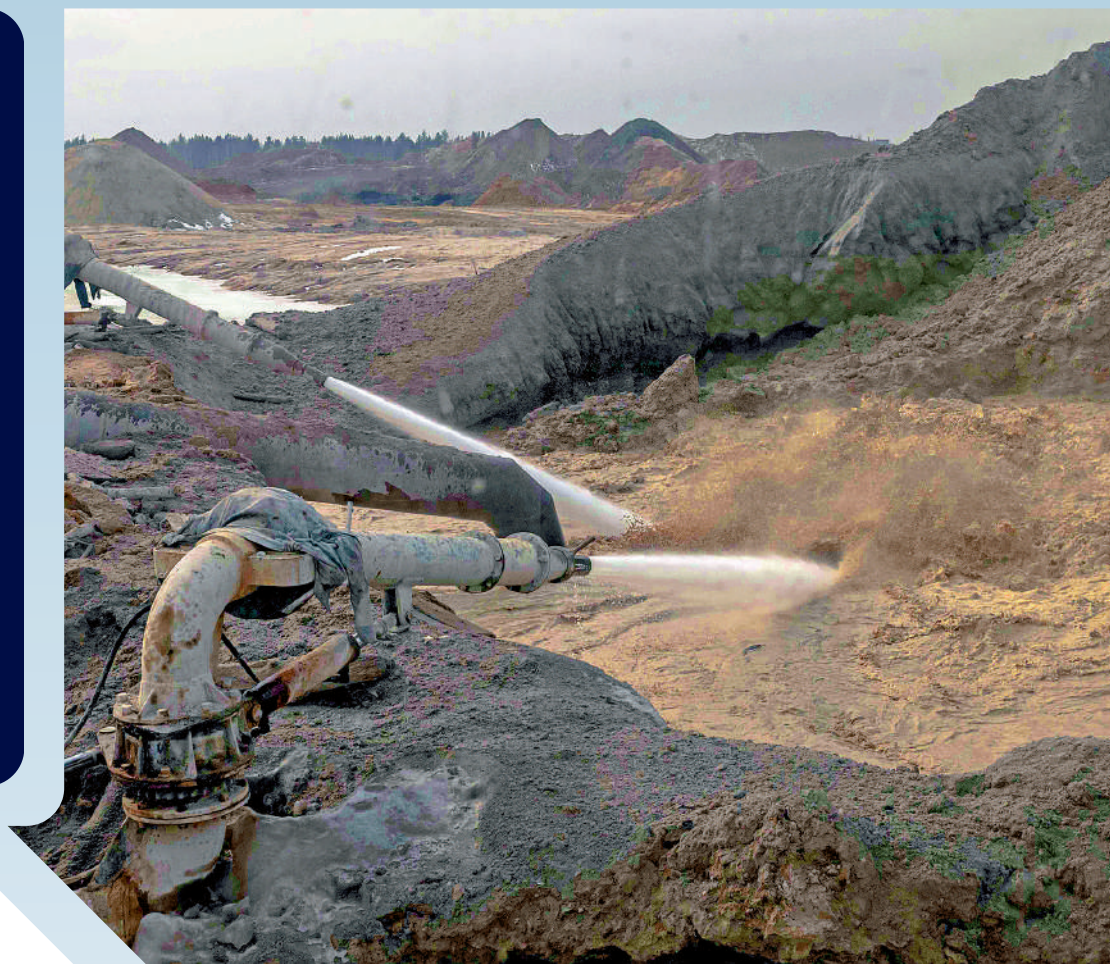
▲與特朗普不歡而散後，澤連斯基鬆口說願意簽署美烏礦產協議。圖為烏克蘭的一處鈦鐵礦。

美烏總統在白宫「談崩」之後，美國的歐洲盟友上演政治秀，力撐烏克蘭總統澤連斯基。英國首相斯塔默先與澤連斯基在倫敦會面後，又宣布英烏簽署22.6億英鎊（約221億港元）的貸款協議。當地時間2日，歐洲多國領導人在倫敦舉行安全峰會，討論烏克蘭危機和歐洲防務問題。有分析指出，一個不團結且在防務上依賴美國的歐洲，在烏克蘭問題談判中掌握的籌碼有限。