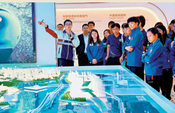
▲「保安局青少年制服團隊領袖論壇」成員昨日參與大灣區研學團在澳門的行程。

【大公報訊】記者陳劍報道：保安局局長鄧炳強昨日（2日）率領「保安局青少年制服團隊領袖論壇」（「領袖論壇」）成員參與大灣區研學團在澳門的行程，完成三日兩夜認識國家歷史文化和不同領域發展的考察，其間參觀了澳門輕軌東線澳氹海底隧道、澳門保安部隊高等學校校園、澳門海關船隊，並遊覽當地古蹟和新舊建築。 鄧炳強於社交平台發文提到，在聽取學員就專題報告作階段性匯報前，特別請大家吃地道葡撻及飲咖啡，表示學習不忘輕鬆下，順便感受一下記憶中的懷舊味道。 鄧炳強表示，深圳大學學生上屆起參與「領袖論壇」的活動，澳門青年今