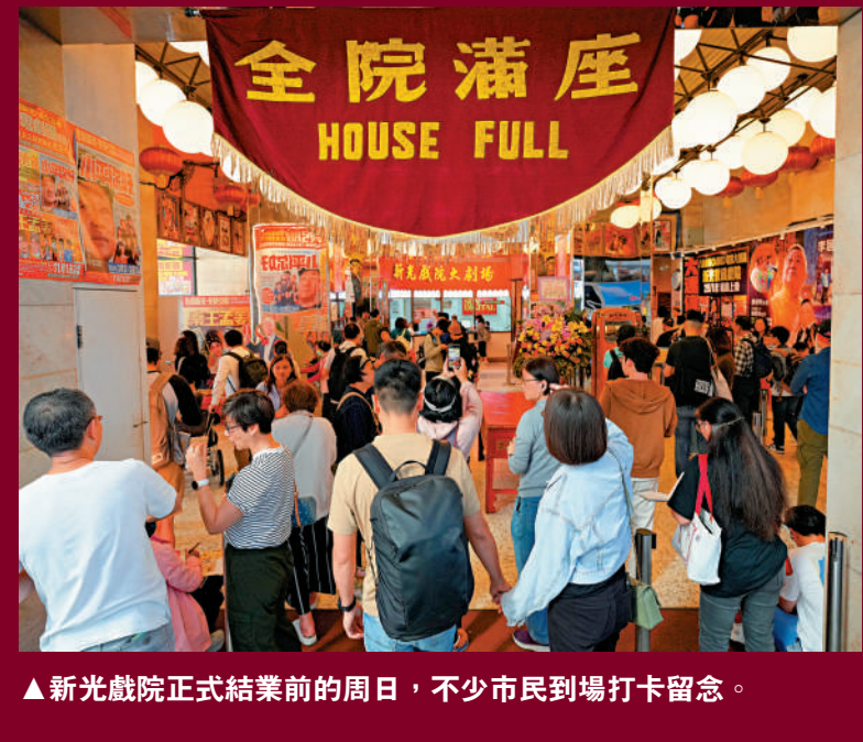
▲新光戲院正式結業前的周日，不少市民到場打卡留念。

陪伴港人逾半世紀、有粵劇殿堂美譽的新光戲院在今晚最後演出後便正式熄燈拉閘，全港最後一間民營粵劇戲院將落下帷幕。 過去兩日，不少戲迷及市民趁周末周日到場拍照留念。有市民回憶三十年前首次在新光接觸粵劇，從覺得粵曲嘈吵，到學會欣賞戲曲並成為粵劇迷；有街坊難忘戲院90年代的輝煌，見證每天演出完場時大批戲迷等候粵劇明星下班，形容戲院結業就像陪伴多年的「好朋友」離別……他們感謝新光為港人帶來珍貴回憶。 大公報記者 鍾佩欣(文) 何嘉駿(圖、攝錄) 融媒組(製作)