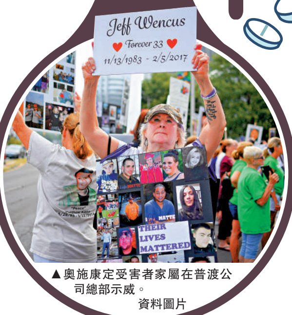
▲奧施康定受害者家屬在普渡公司總部示威。