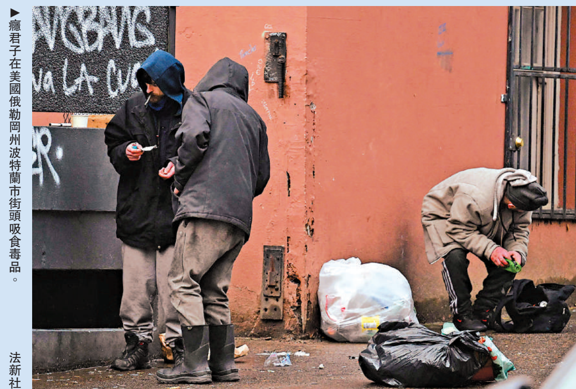
▲癮君子在美國俄勒岡州波特蘭市街頭吸食毒品。