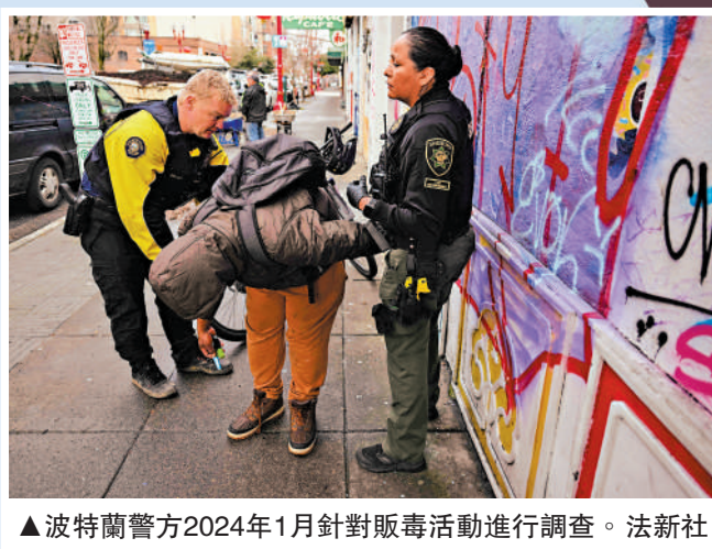
▲波特蘭警方2024年1月針對販毒活動進行調查。