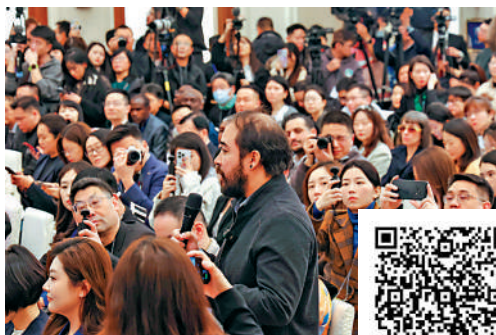
▲3日，巴西勞動者電視台記者提問。

「田間地頭、車間碼頭」「有舞台、有溫度、有成效」「學在深處、謀在要處、幹在實處」……劉結一的回答，既扎實懇切，又自信坦誠。一言以蔽之，搞好自己的事，做開放自信的國家，日益成為世界眼中的中國印象。當今時代，國際局勢很不太平，與之密切相關的，是一些國家值得玩味的個性與作為：不謀自身發展，但求巧取豪奪；不謀互利共贏，但求單邊至上……在這樣的導向下，國際場開始透出角鬥場的意味，大合唱漸漸變成眾聲喧嘩的亂局。