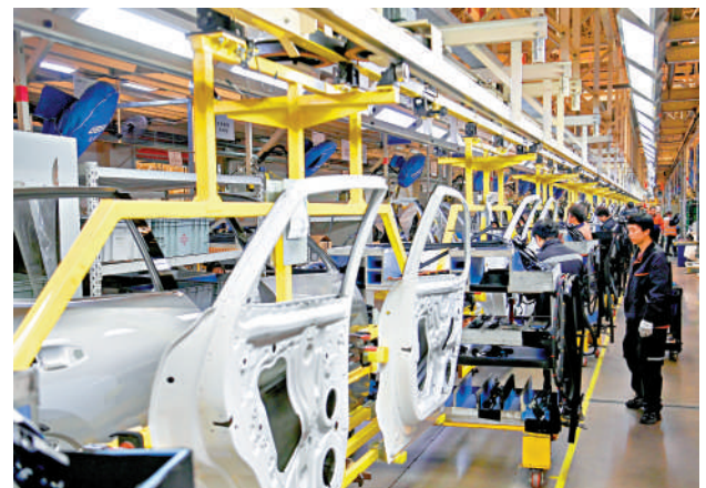
▲2月26日，工作人員在吉利汽車寶雞製造基地總裝廠生產線上作業。

近年來中國農村電商增勢迅猛。據商務大數據監測，2023年中國農村網絡零售額達2.5萬億元，比2014