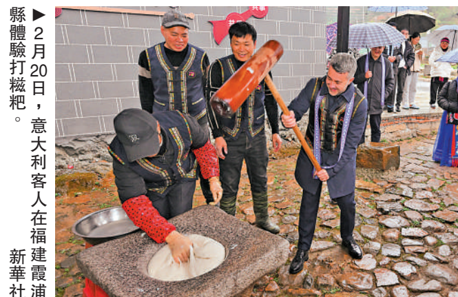
縣體驗打糍粑。2月20日，意大利客人在福建霞浦新華社

蛇行千里，跨越新程。2025年全國兩會大幕拉開，即將釋出的新政策不僅將助力「十四五」取得圓滿收官，更為「十五五」做好謀劃夯實基礎。在過往的發展進程中，中國經濟披荊斬棘，彰顯韌性，活力滿滿，獨具魅力。一處處重大基建拔地而起，一項項科研成果舉世矚目，一場場繁華盛景令人欣喜，一個個文化ID強勢崛起。大公報今起推出《蛇行千里》系列專題，聚焦中國經濟澎湃活力，在高質量發展軌道上行穩致遠，駛向更加美好的明天。