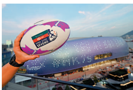
▲國際七人欖球賽3月底在啟德體育園舉行，其間鄰近酒店的房價高達3000元。

七欖球賽於本月28日至30日(周五至周日)在啟德體育園舉行，大公報記者昨日以顧客身份，向九龍區多間酒店查詢房間價格和預訂情況。其中，尖沙咀瑰麗酒店、紅磡嘉里酒店等的工作人員表示，目前仍有種多房型的房間可供預訂。記者查閱多間酒店的官方網頁，毗鄰啟德體育園的一間酒店，七