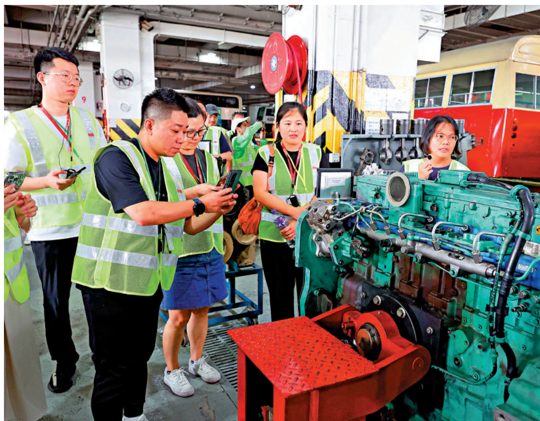
▲今年初有大批內地研學旅客訪港，行程包括參觀九巴學院。

批發及零售界立法會議員邵家輝指出，今年1月入境旅客有20%增長，相信未來會愈來愈多，期望更多大灣區內地城市可以盡快放寬「一周一行」，甚至可以「一簽多行」，有助香港整體經濟發展，亦能助大灣區更好融合。